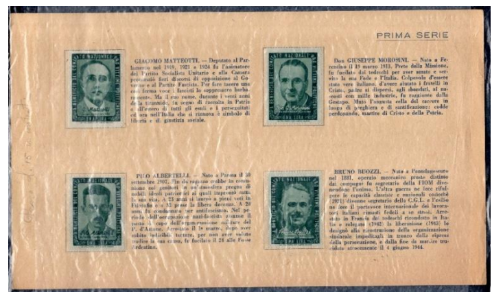
1° Libretto nr. 8 v. da £ 1 Verdi e Rossi